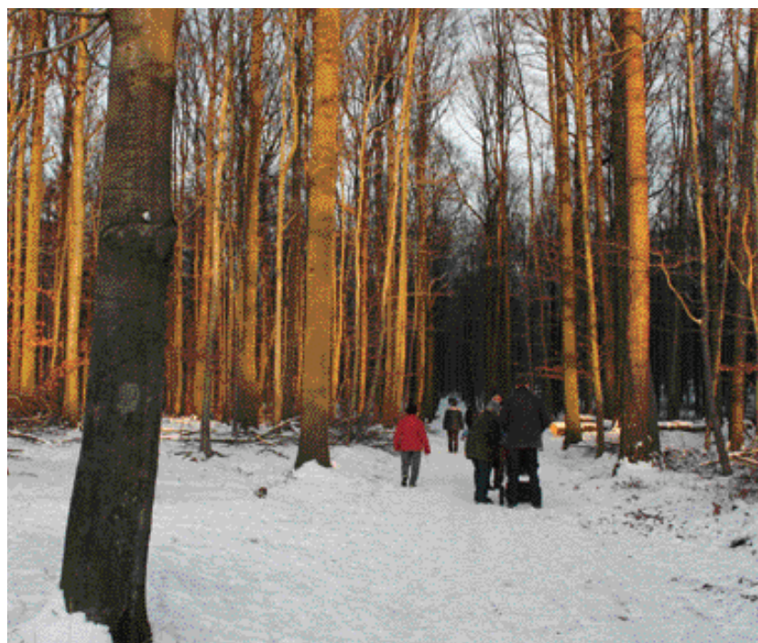
Balade hivernale en forêt de Soignes

L'équipe Van Ingelgem vous souhaite une très joyeuse fête de Noël et vous présente ses meilleurs vœux pour l'année nouvelle .